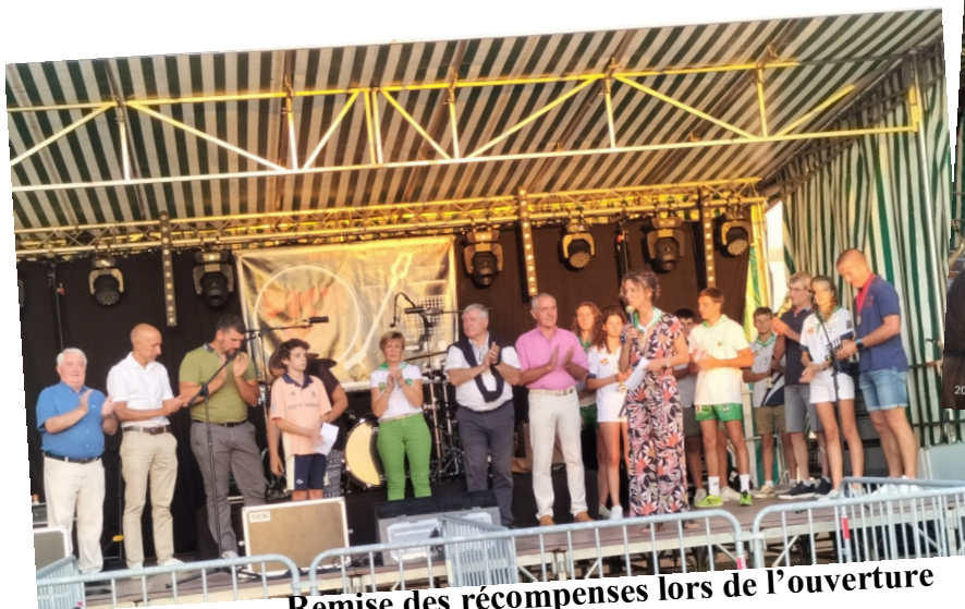
Remise des récompenses lors de l'ouverture