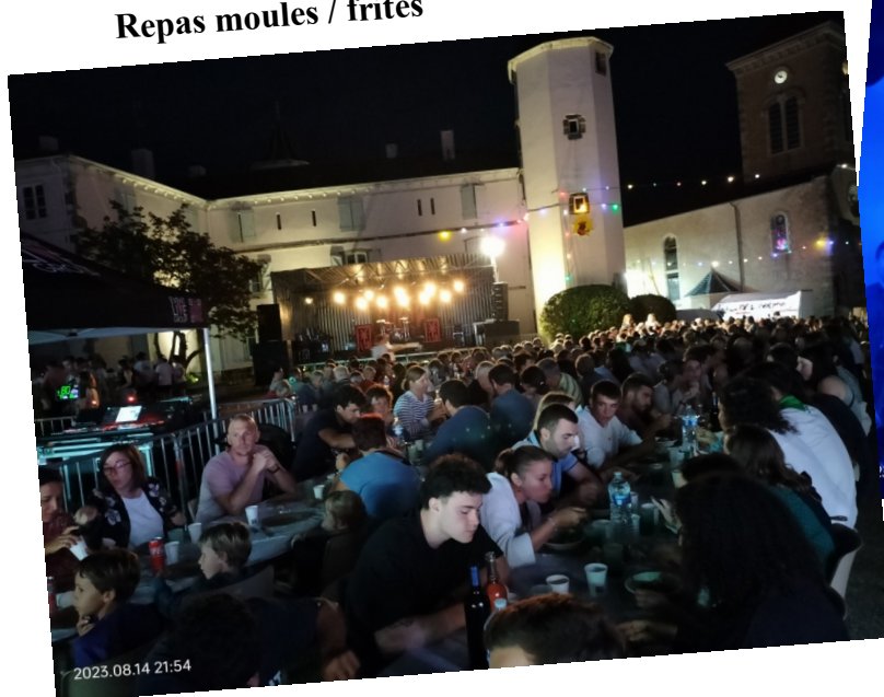
Repas moules / frites