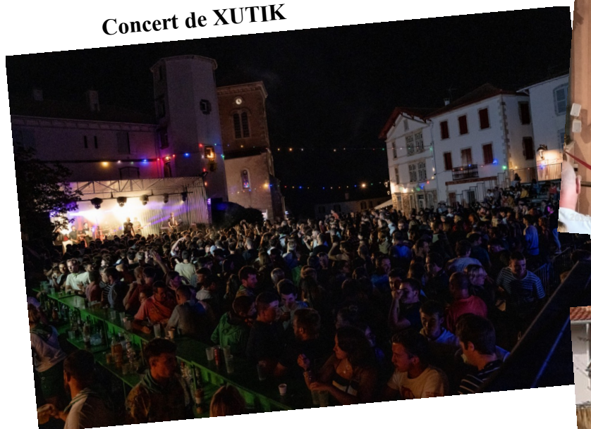
Concert de XUTIK