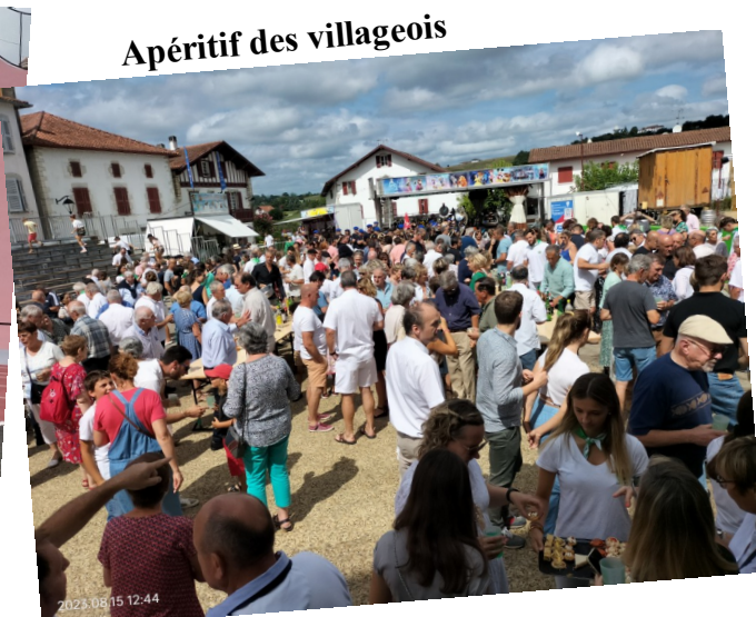
Apéritif des villageois