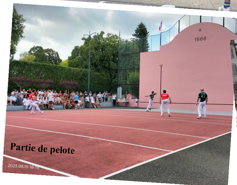
Partie de pelote