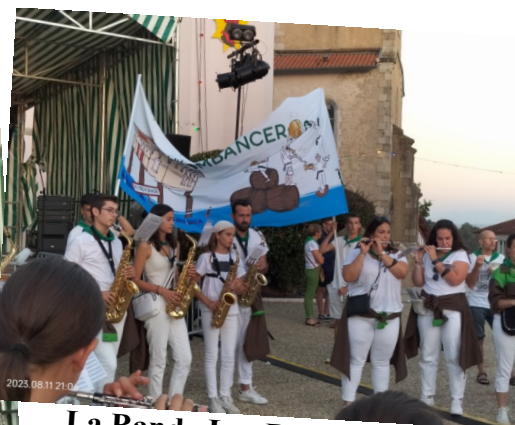
La Banda Los Bombanceros