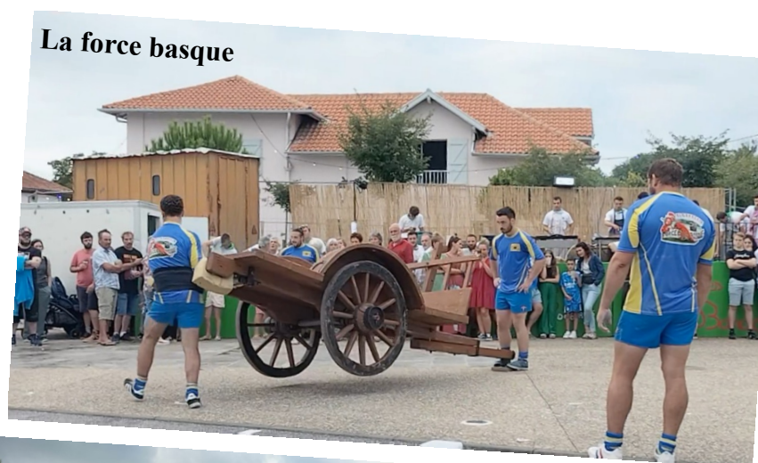
La force basque