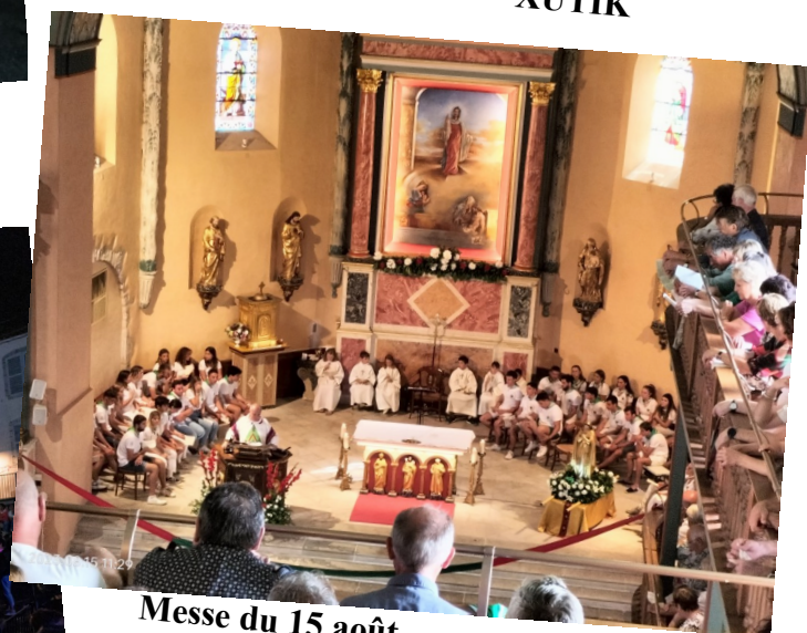
Messe du 15 août