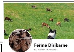
Ferme Diribarne 933 7 ans - 18 Solitaires